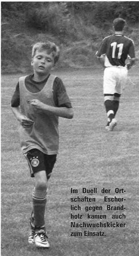
Im Duell der Ortschaften Escherlich gegen Brandholz kamen auch Nachwuchskicker zum Einsatz.